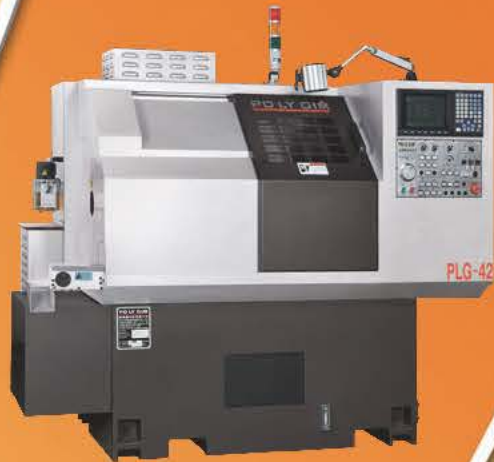
Model: PLG-42 (ø42)

GANG TYPE CNC LATHE 櫛式型車床 • Max. turning dia. 最大加工外徑： ø25mm ~ ø60mm (collet chuck筒夾) ø60mm ~ ø380mm (3-jaws chuck三爪夾頭)