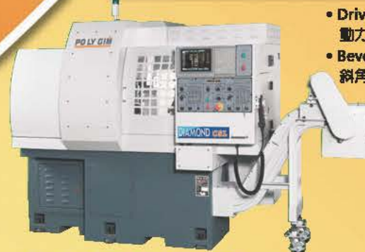
Model: CSL 12-2Y / CSL 16-2Y

• Driven tool 動力刀具數：5支 • Bevel driven tool 斜角度動力刀具數：6支