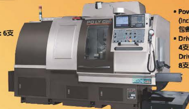
Model: CSL 42-2Y / CSL 42-2YI

• Power turret 動力刀塔：12支 (Including 4 pcs bevel driven tool 包含4支斜角度動力刀具) • Driven tool 動力刀具：4支(CSL 42-2Y) Driven tool 動力刀具：8支(CSL 42-2YI)