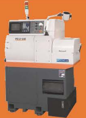
Model: 12 / 12CS / 16 / 16CS

• Driven tool 動力刀具數：4支 —Diamond 12CS / 16CS