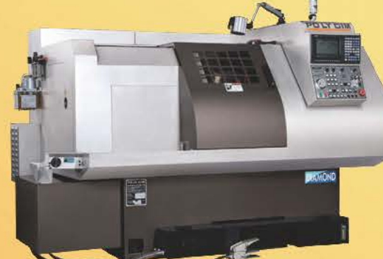
Model: Diamond 42 / 52 / 60

TURRET TYPE CNC LATHE 刀塔型車床 • Max. turning dia. 最大加工外徑： ø42mm ~ ø60mm (collet chuck筒夾) ø130mm ~ ø380mm (3-jaws chuck三爪夾頭)