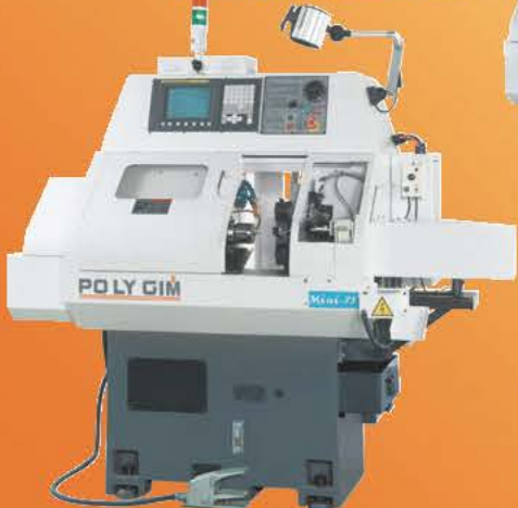
CNC自動上下料車床 Model: MINI-88 with Loading / Unloading Device

GANG TYPE CNC LATHE 櫛式型車床 • Max. turning dia. 最大加工外徑： ø20mm ~ ø25mm (collet chuck筒夾) ø60 (3-jaws chuck三爪夾頭)