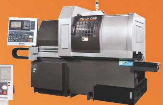
Model: Diamond 20B II / 32B I / 42B I Model: Diamond 20CSB I / 32CSB I / 42CSB I Model: Diamond 12B III / 16B III / 20B III / 25B III Model: Diamond 12CSB III / 16CSB III / 20CSB III / 25CSB III

• Driven tool 動力刀具數：16支 —Diamond CSB I / CSB III