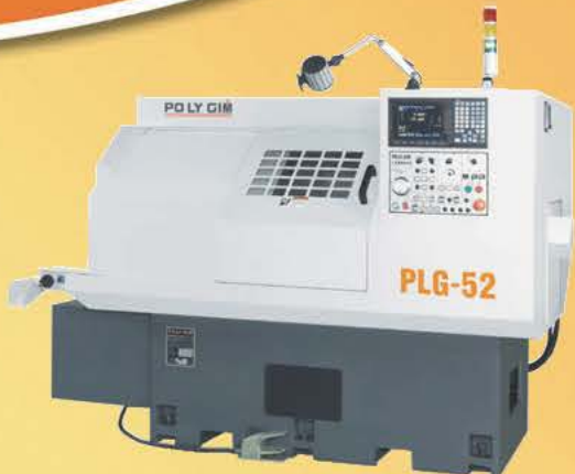
Model: PLG-52 (ø52) / PLG-60 (ø60)