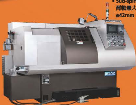
Model: Diamond 42 / 52 / 60

• Main spindle max. turning dia. 主軸最大加工外徑： ø42mm ~ ø60mm (collet chuck筒夾) • Sub-spindle max. turning dia. 副軸最大加工外徑： ø42mm (collet chuck筒夾)