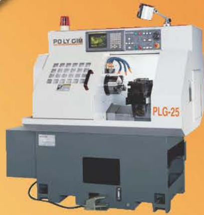
Model: PLG-25 (ø25)