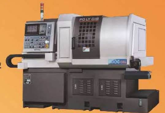
Model: 25CSL / 32CSL / 42CSL

• Driven tool 動力刀具數：11支 • Bevel driven tool 斜角度動力刀具數：3支