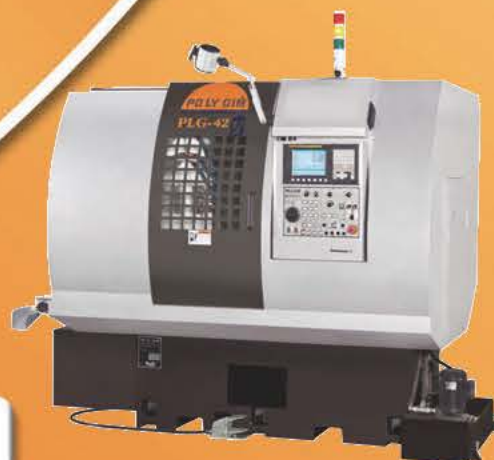
Model: PLG-42Y / PLG-52Y / PLG-60Y